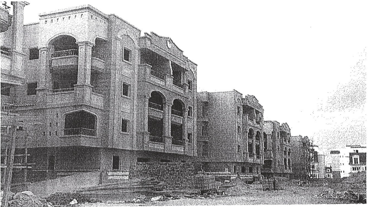
وحدات سكنية تحت الإنشاء شرق العاصمة القاهرة، مصر

11:26 صباحاً 15 يناير 2023 - 19:03 مساءً 13 يناير 2023