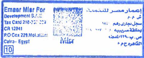
جمال ماجد خلفان بن ثنية رئيس مجلس الإدارة