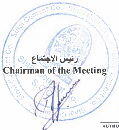
رئيس الاجتماع Chairman of the Meeting