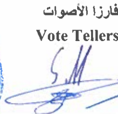
فارزا الأصوات Vote Tellers