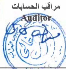
مراقب الحسابات Auditor