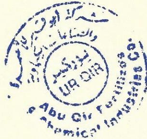
Accountant / Khaled Mostafa Sokkar