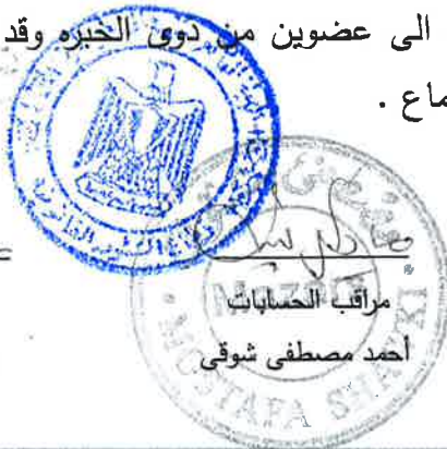
مراقب الحسابات أحمد مصطفى شوقى